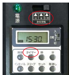
「タイマー設定」と「簡単温度設定」

時刻で設定できるON/OFFタイマー機能がついていますので、効率運用が図れます。一度設定してしまえば、電源の入れ忘れ、消し忘れを防止できて便利です。